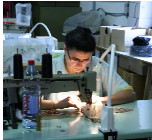
Atelier de Saint Ferréol dans le 43