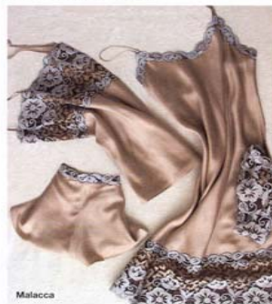
Le monde d'alba

Grande ricerca sui tessuti per ottenere effetti inediti, come per esempio la scelta della fibra di legno, che permette di dare vita a una lingerie morbida, fluida, estremamente sensuale, elegante, sempre abbinata al pizzo di Calais. La collezione di lingerie MALACCA ha dietro uno spirito fortemente etico, che sceglie tessuti e materiali sempre nel rispetto della natura, il suo principale imperativo. Nella collezione per la primavera-estate 2004, oltre alla fibra di legno, troviamo il lino fresco e molto estivo. Tutti i capi sono declinati in colori brillanti come il blu intenso e il corallo, o sofisticati, come rosa sandalo e polvere, sabbia, avorio e perla. Info: Malacca - tel. +33/1/53170378